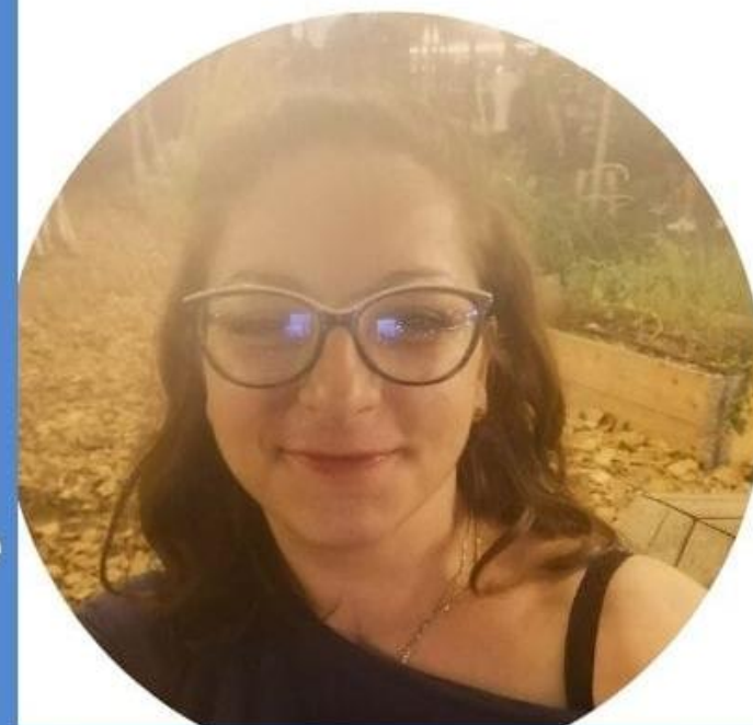
MARIAPINA BALESTRA SCUOLA SECONDARIA DI PRIMO GRADO

È necessario che la scuola riprenda la sua centralità nella società contemporanea e che riacquisti il suo valore. Noi ci impegniamo perché ciò avvenga.