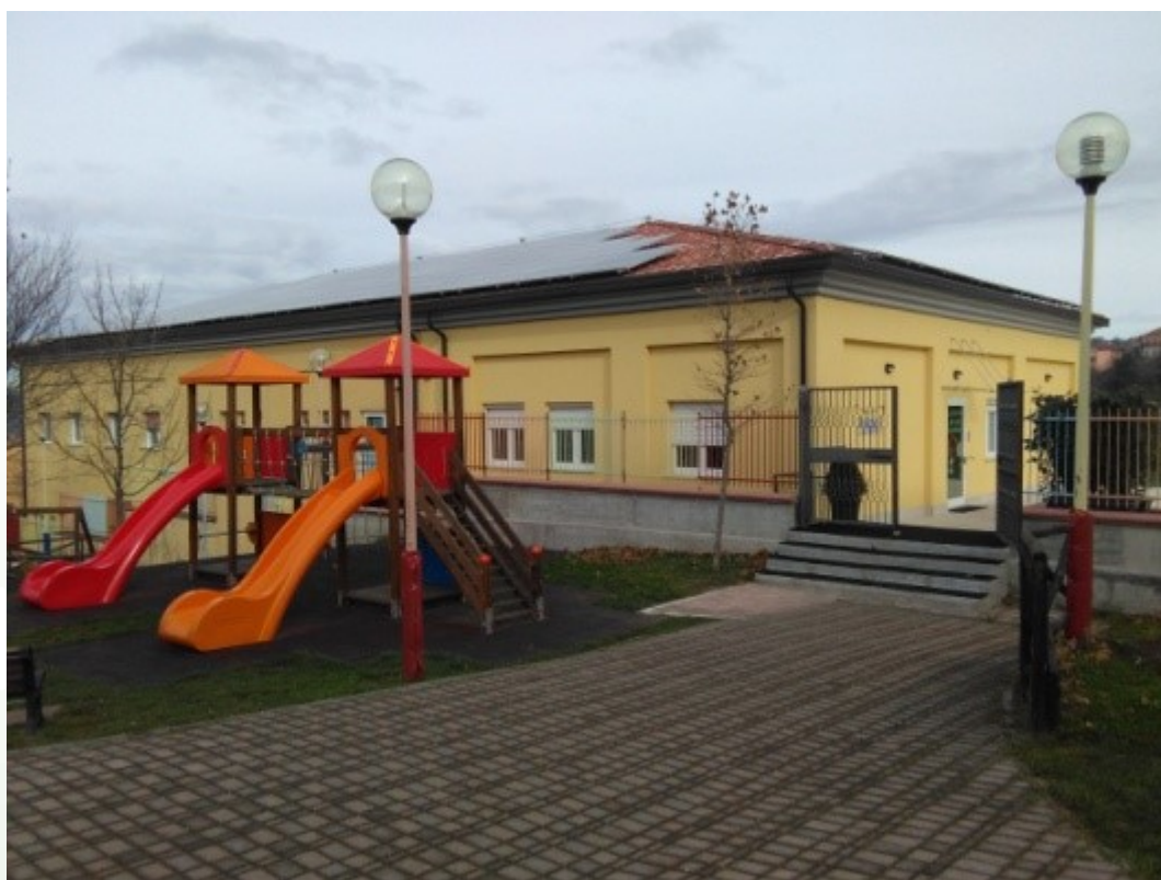
Foto dei vari plessi

Il corso A è stato collocato presso l'edificio della Scuola dell'Infanzia di Pignola sito in Via Risorgimento 1 e il corso B presso l'edificio della Scuola Secondaria di Primo Grado sito in Via C. Colombo 1.